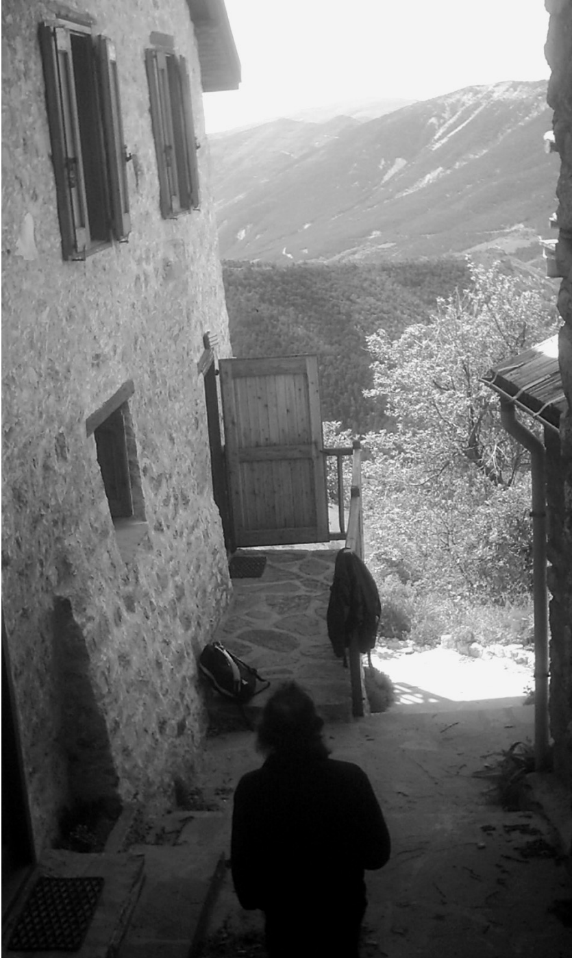
L'Esprit de la Commune vivra éternellement dans nos cœurs virtuels